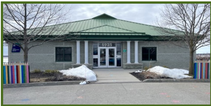
Centre Communautaire des Loisirs de St-Thomas d'Aquin, 5925 rue Pinard, St-Hyacinthe