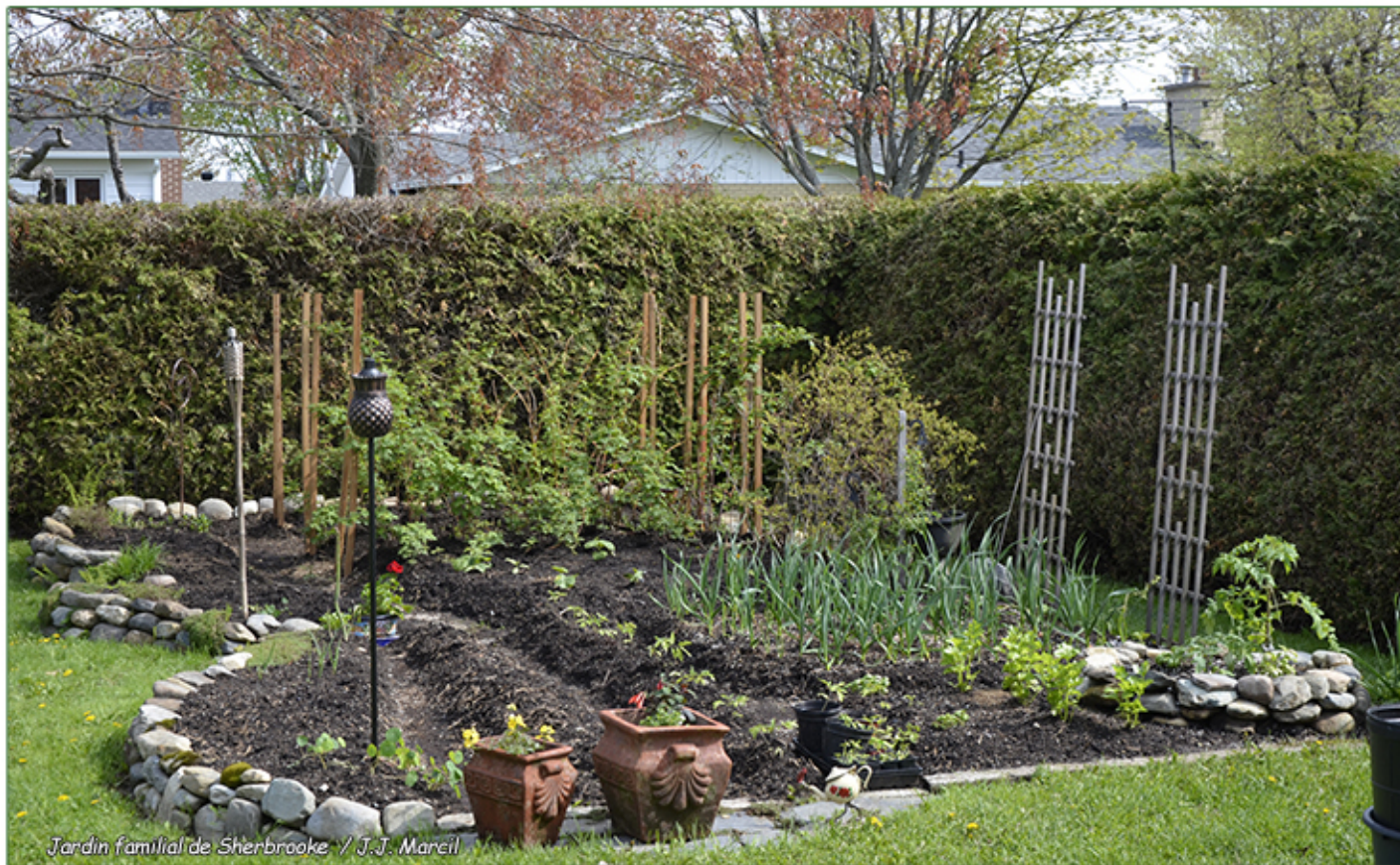
Jardin familial de Sherbrooke / J.J. Marcil

Le R.J.É. permet de se rassembler pour partager la vie, l'amour de la terre, des plantes et du jardinage dans son sens le plus noble, tout en préservant l'environnement pour que les prochaines générations puissent en jouir pleinement.